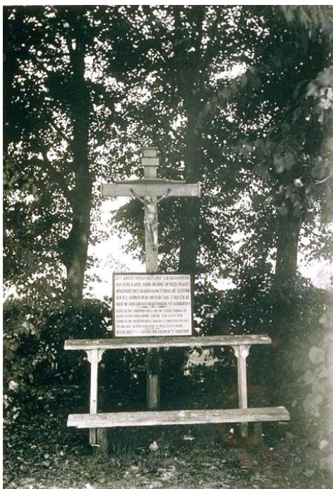
Het kruis uit 1840 met offerblok, tekstbord en knielbank.

In 1958 werd besloten dat het gedenkteken aan vervanging toe was en kreeg het monument de huidige vormen. De halfronde muur bestaat uit kinderkopjes welke afkomstig zijn van de markt in Deurne.