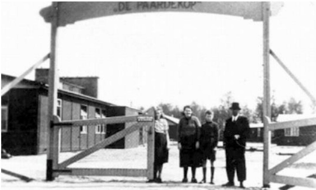
Waarschijnlijk de eerste bewoners in een van de barakken aan de Paardekopweg.

Deze werkkampen waren voor de Maastrichtse en andere Zuid - Limburgse gemeenten. In ieder kamp, in de volksmond barak genoemd, was plaats voor 96 personen. Ten tijde van de bouw waren reeds 3000 mensen werkzaam bij de werkverschaffing. Men ging er zelfs van uit dat dit wel tot 4 à 5000 kon stijgen.