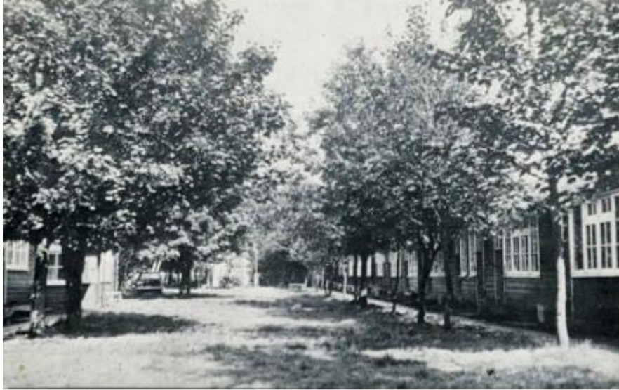
Een foto van de barakken aan de Timmermannsweg van na de oorlog.

Deze werkkampen waren voor de Maastrichtse en andere Zuid - Limburgse gemeenten. In ieder kamp, in de volksmond barak genoemd, was plaats voor 96 personen. Ten tijde van de bouw waren reeds 3000 mensen werkzaam bij de werkverschaffing. Men ging er zelfs van uit dat dit wel tot 4 à 5000 kon stijgen.