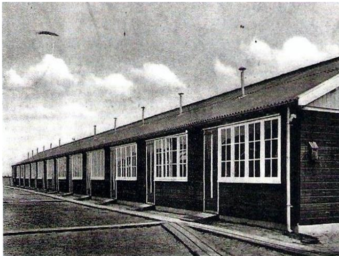
Een foto van hoe de barakken er in het begin in 1939 uitzagen.