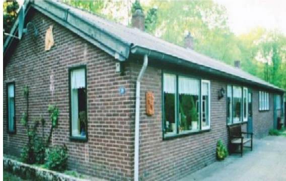
Kamp C (Paardekopweg 30) dat het langst bewoond is. Foto van 2008, net voordat de laatste bewoner vertrok.

gesteld bij de ontginning van de Peel. Het was hard werken voor deze mensen, waarvan er velen niet gewend waren met de schop te werken. In de barakken hebben in de loop van de tijd tal van mensen gewoond voor kortere of langere tijd. Het was ook soms een uitwijkmogelijkheid voor mensen die in Venray geen woning konden krijgen. Ook woonden er mensen die later naar een boerderij in Peel Plan Zuid vertrokken. De laatste bewoner vertrok in 2008 uit kamp C.