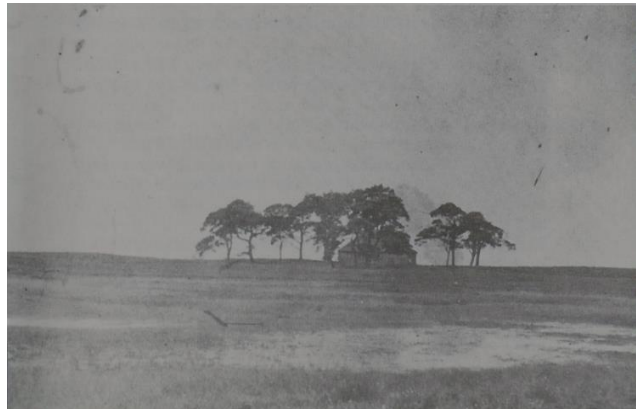
De Bommeköj van de familie Bom gebouwd omstreeks 1855

voedingswaarde. Als de bodem van de stal te nat werd kwam er weer een nieuwe laag plaggen overheen en zo telkens opnieuw. In het voorjaar werden de kooien uitgemest en de mest op het land gebracht.