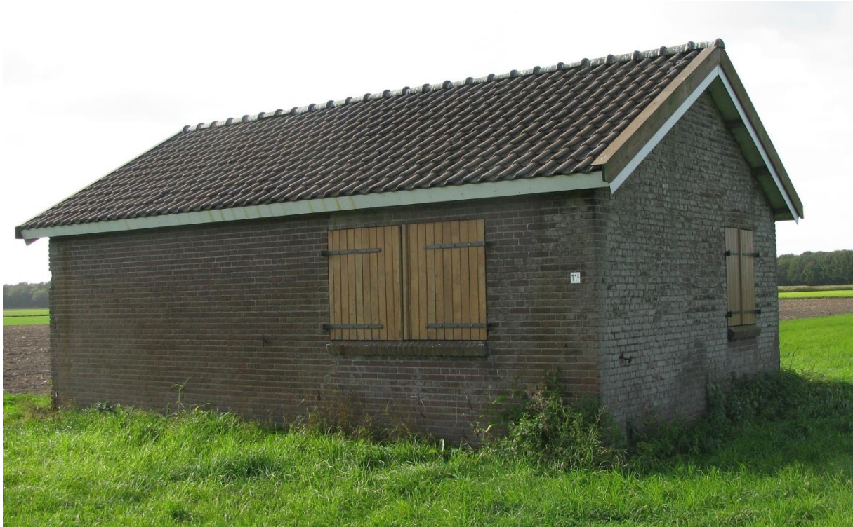
Voorkant van het voor U liggende gerestaureerde Wehrmachtshuisje.

Ongeveer 100 m. noordwaarts stond een zogenaamd Wehrmachtshuisje. Dit Wehrmachtshuisje werd in 1941 door de Duitsers gebouwd en was een van de velen in Noord Limburg. Het werd in 2013 door de huidige eigenaar gerestaureerd. Op 21 oktober 2010 werd het huisje helaas afgebroken door de nieuwe eigenaar van de grond. In de gemeente Venray alleen al stonden er 7.