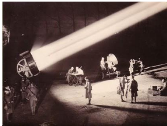
Zoeklicht in werking om vliegtuigen te onderscheppen.

De bemanning van de huisjes luisterde 's avonds aandachtig het luchtruim af of zij iets hoorden. Wanneer zij iets hoorden werd contact opgenomen met het Duitse Oorlogsvliegveld in Venlo, De Fliiegerhorst, om hier melding van te maken. Hier stegen dan jachtvliegtuigen op om de vijandelijke vliegtuigen te onderscheppen en neer te schieten. De bemanning van de Wehrmachtshuisjes had inmiddels zeer sterke zoeklichten ingeschakeld en probeerde hiermee de vliegtuigen in beeld te krijgen.